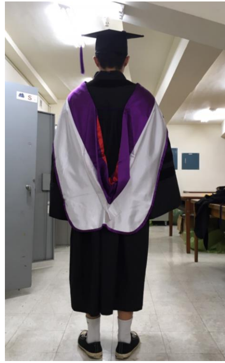
博士服 - 白底紫面 (背面)