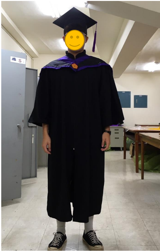
碩士服 - 黑底紫面 (正面)