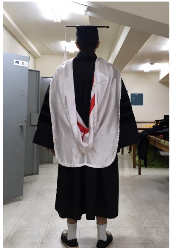
博士服 - 白底白面 (背面)