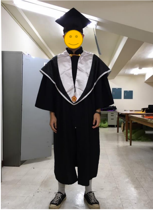
碩士服 - 黑底白面 (正面)