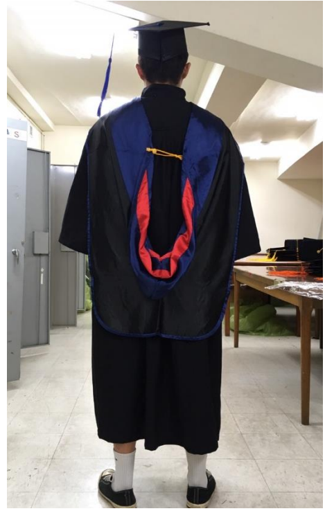
碩士服 - 黑底藍面 (背面)