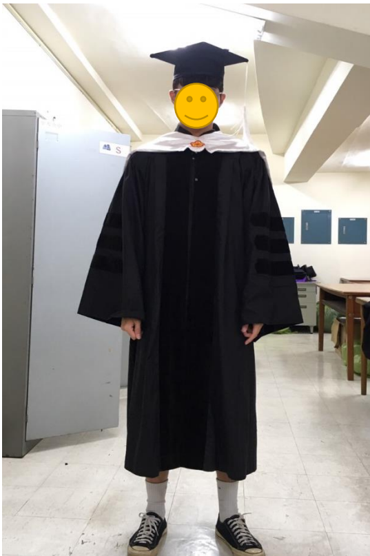
博士服 - 白底白面 (正面)