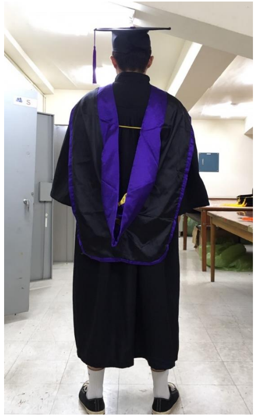
碩士服 - 黑底紫面 (背面)