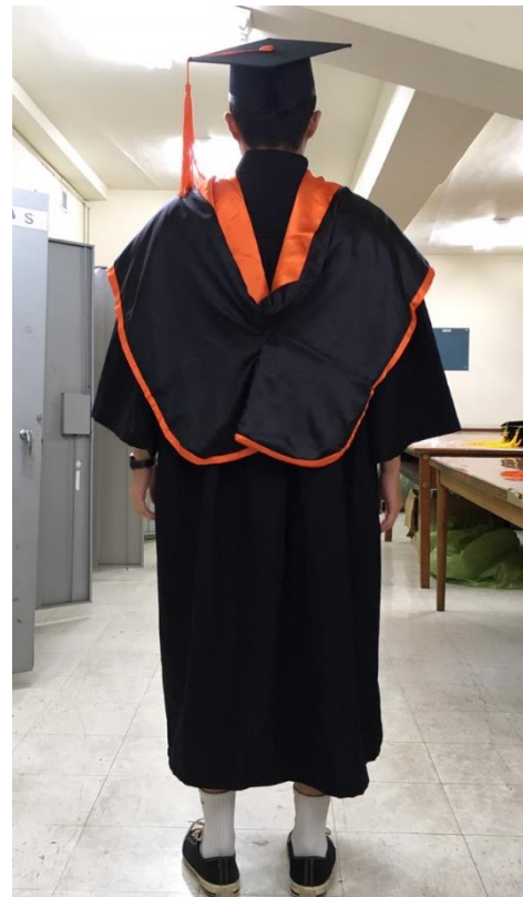
碩士服 - 黑底橘面 (背面)