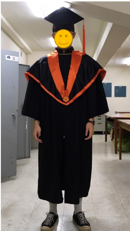
碩士服 - 黑底橘面 (正面)