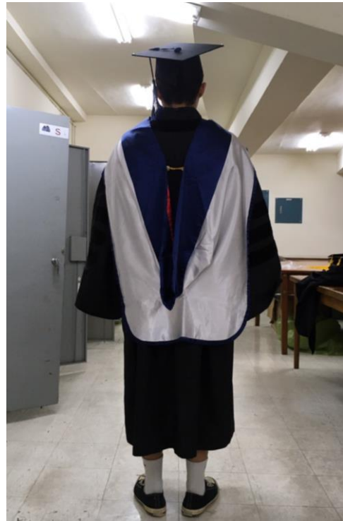
博士服 - 白底藍面 (背面)