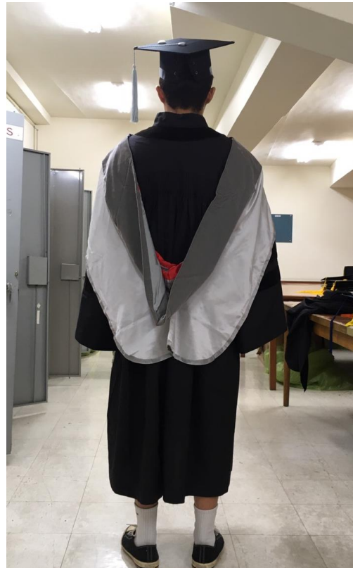
博士服 - 白底灰面 (背面)