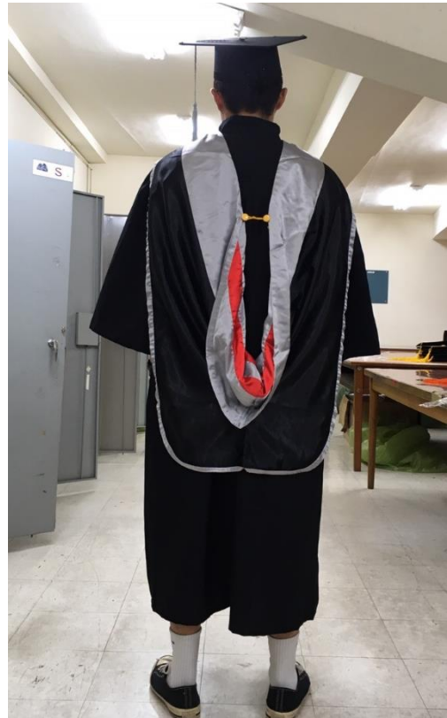
碩士服 - 黑底灰面 (背面)