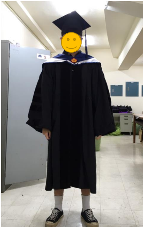
博士服 - 白底藍面 (正面)