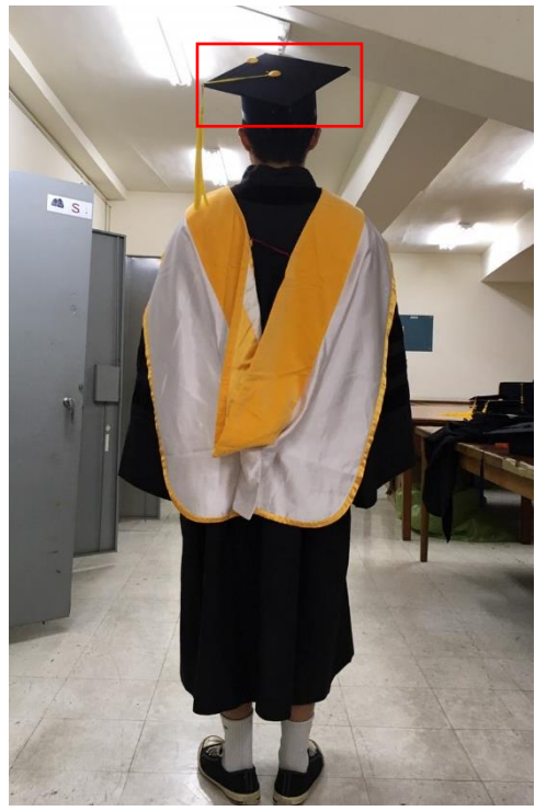
博士服 - 白底黃面 (背面)