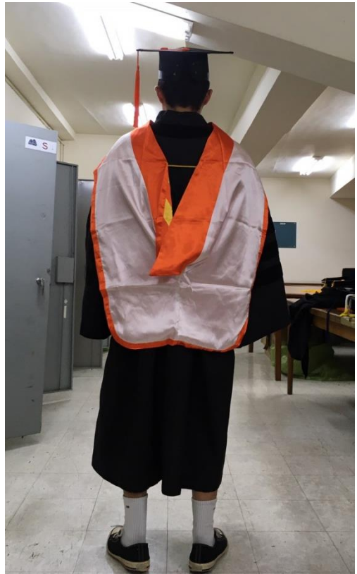
博士服 - 白底橘面 (背面)