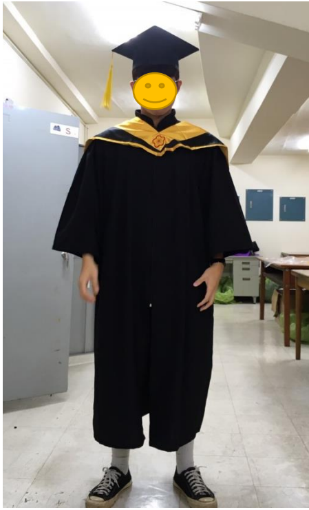
碩士服 - 黑底黃面 (正面)