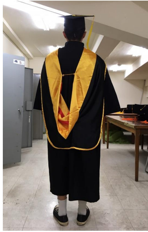
碩士服 - 黑底黃面 (背面)