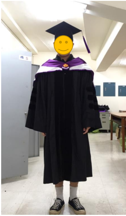
博士服 - 白底紫面 (正面)