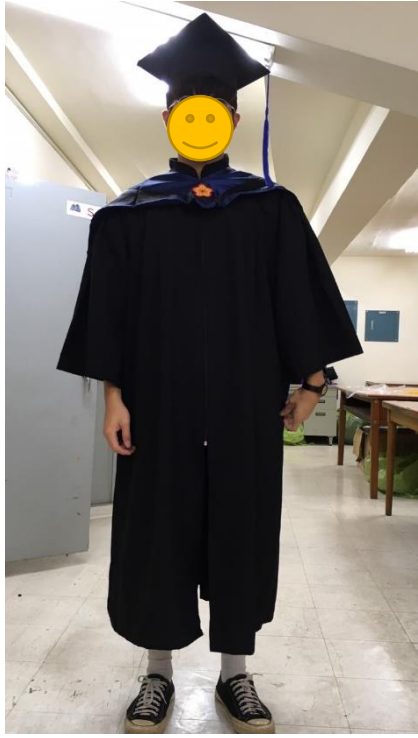
碩士服 - 黑底藍面 (正面)