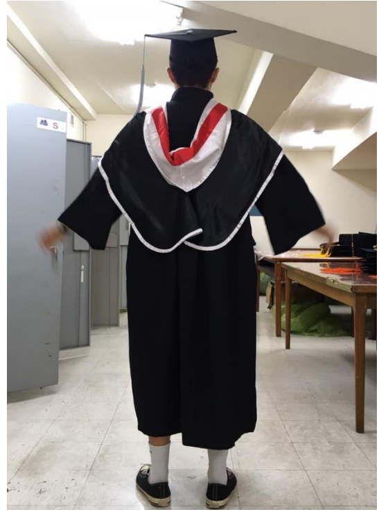
碩士服 - 黑底白面 (背面)