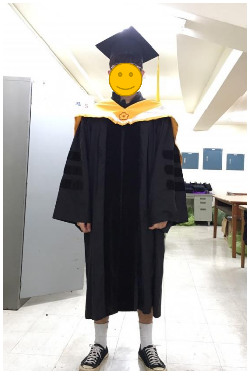
博士服 - 白底黃面 (正面)