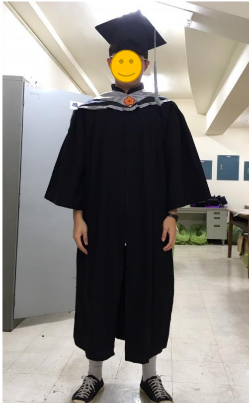
碩士服 - 黑底灰面 (正面)