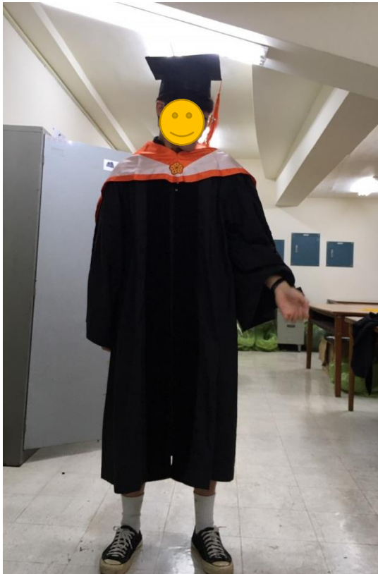
博士服 - 白底橘面 (正面)